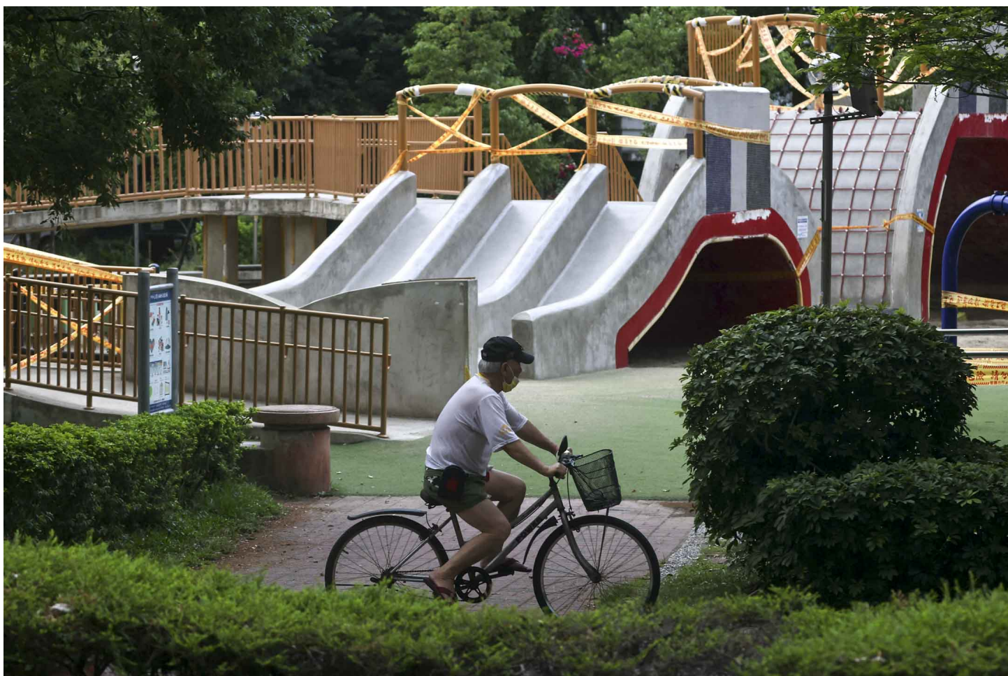
2021年5月21日，台北新冠病毒感染率上升後，男士騎單車經一個關閉中的公園。