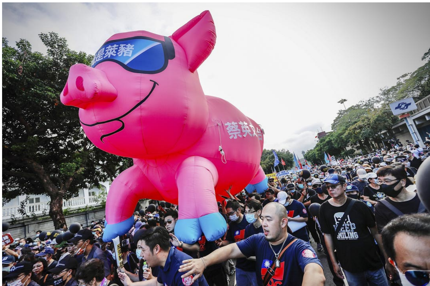
2020年11月22日台北，數十個團體舉行「秋鬥」大遊行，示威者聚集在總統府外遊行至民進黨總部，抗議蔡英文政府放寬從美國進口含瘦肉精豬肉。