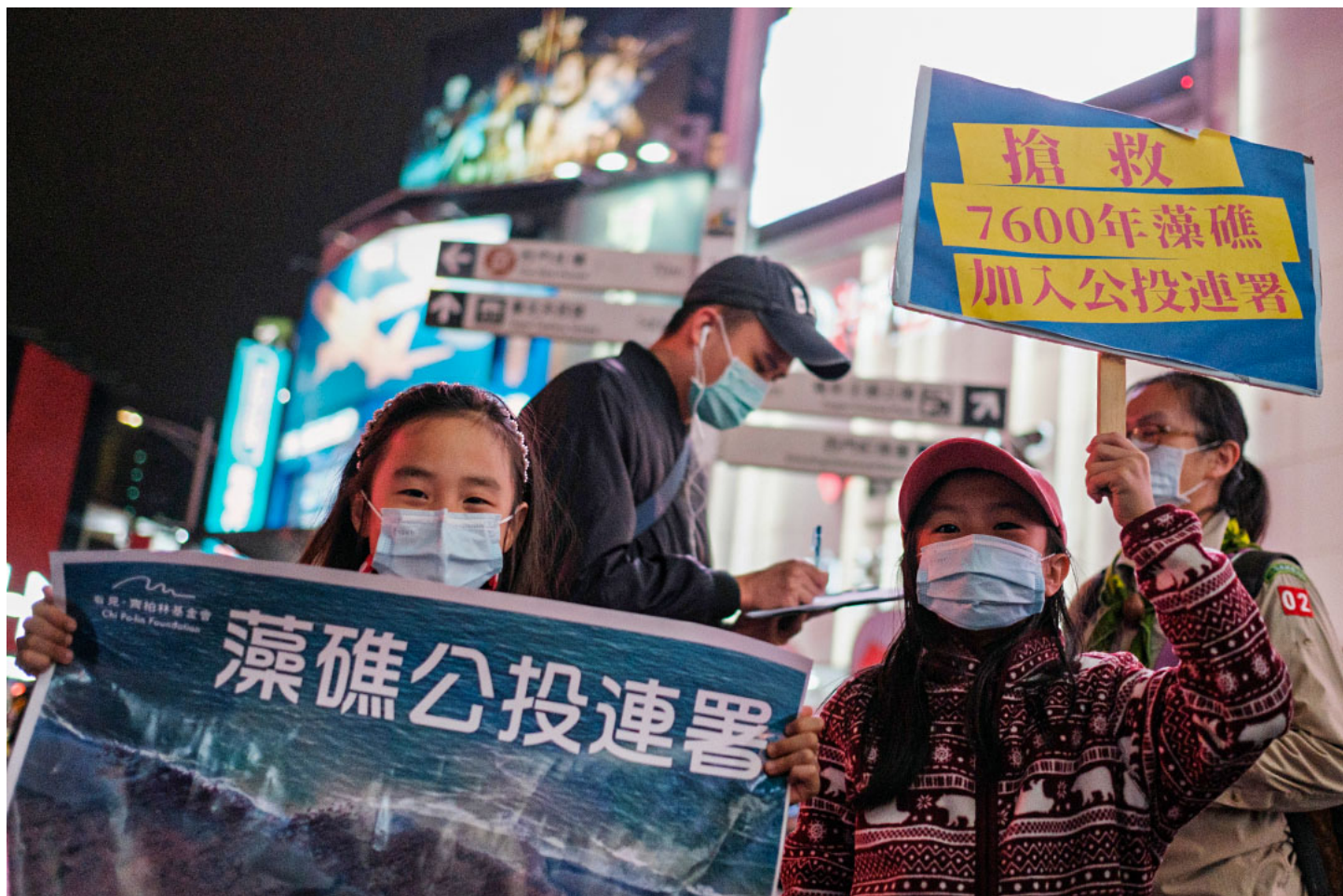
2021年2月28日台灣中壢，志工擺攤呼籲市民支持藻礁公投案的連署。