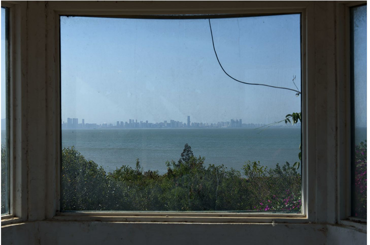
金門對岸的中國廈門市。

與此同時，中國也在不斷使用其愈來愈強的經濟、軍事及外交力量，讓兩岸統一看起來是勢在必行的。然而台灣認同的崛起，加上北京對新疆和香港政策，都讓台灣人變得更不願意與中國統一，也導致北京必須加大力度，在國際社會中孤立台灣。