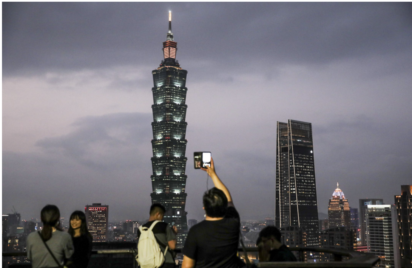
2021年1月 6日，台北的黃昏時分，台北101大樓和其他被照亮的建築物。